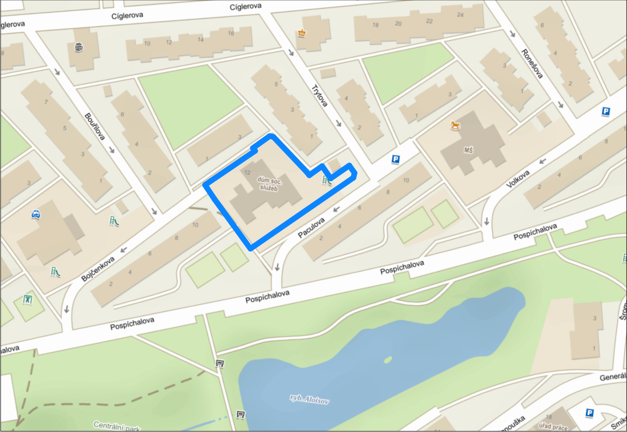
SITUACE - ČÁST MČ PRAHA 14 - ČERNÝ MOST, 1:2500